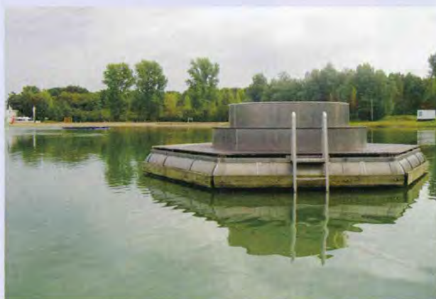
Gernsheimer Badesee: Die wirkungslose Tiefenbelüftung wurde zur Badeinsel umfunktioniert.

R. P.: Diese einzigartige Tropenwaldhalle ist komplett geschlossen, umfasst 2800 Quadratmeter und ist 14 Meter hoch. In ihr leben circa 360 Vögel, Kleintiere und Fische, darunter auch die ganz selten gewordenen Paradiesvögel. In diesem hochsensiblen Bereich wurde von Beginn an die Konzeption Boden-Wasser-Pflanze ausschließlich mit meinem System umgesetzt. Im geschlossenen Wasserkreislauf wird nur das verdunstete Wasser ersetzt. Trotz der hohen Tierpopulation und den tropischen Temperaturen, kommt es zu keiner bakteriologischen Belastung. Aus diesem Grund ist in der gesamten Halle kein einziges Tränkebecken. Die Tiere können aus dem Wasser trinken, in dem sie leben und in das sie ihre Ausscheidungen abgeben. Das optimale Wachstum der Pflanzen wird weder mit chemisch-synthetischen noch mit anderen biologischen Düngern oder Pflanzenschutzmitteln unterstützt. Das Pflanzenwachstum ist trotzdem so üppig, dass jährlich große Mengen ausgeschnitten werden müssen. Ein anerkannter Fachmann, ehemals sehr kritisch zu meinem System, stellte fest: „Das hätte ich nie gedacht, ich bin überwältigt von der Wasserqualität, der Pflanzenvitalität und dem optimalen Hallenklima ohne Geruchsbelästigung.“