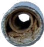
Rohrleitung 10 Jahre alt