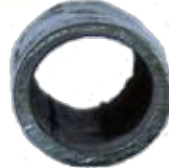
6 Monate später mit plocherkat

Wir arbeiten und messen nach dem Stand der Technik mit wissenschaftlich anerkannten Messmethoden.