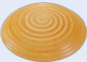
plocher harmonizer Art.-Nr. ha 5111

In jedem Fall sind der plocher harmonizer und der plocher e-smog-winkel zu empfehlen: